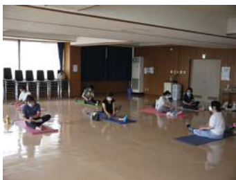
丁寧に足指を1本づつマッサージする様子