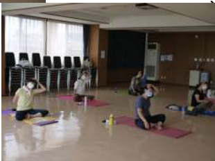
頭を手で傾げるポーズをする参加者の様子

前年度は、新型コロナウイルス感染拡大により活動が1年間休止となり、今年度も第3派の影響で一時中断したが、7月から再開することとなった。