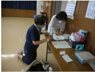
受付での消毒の様子