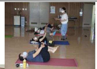
指導者の指導によりいろいろなポーズを行う参加者

ワイスポ活動に参加した方からは、「コロナ禍で運動不足となり『ワイスポ』が再開され、やっと運動が出来るようになってきて、大変うれしく思っている。早く終息し安心してスポーツができるようになって欲しい！」と話していた。