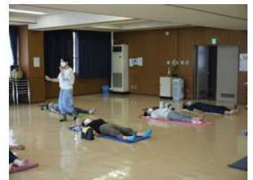
参加者の間を歩きながらアロマスプレーを噴射される指導者の様子