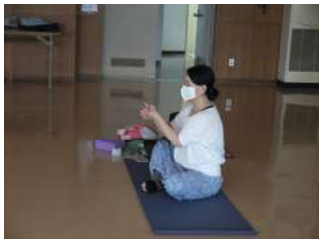
指導者の説明の様子

中には、体が硬くポーズするのが難しい参加者にはできる範囲で痛くない程度で行うよう、指導されていた。