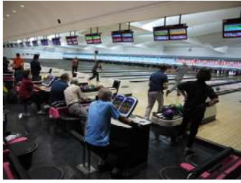
ボックス内の様子(上)と一球入魂で投球する参加者の様子(右)

ゲームは、ソーシャルディスタンスを守りながら行われていた。ストライク・スペアが取ら