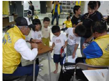
心配そうに弟の握力想定を 覗き込む様子(下)

子ども達も上体起こしや握力では、真っ赤な顔をして必死で頑張る子・友達と競い体を震わせながら頑張っている子も。また、参加者の中には、カメラを向けられると恥ずかしそうに顔を隠しながら上体起こしを頑張るお母さんもいた。3種目の体力測定であるが、毎年参加され体力のチェックをされる参加者も沢山見受けられた。 「この機会を捉え一人でも多くの方々が、体力の維持に興味を持ち生涯スポーツとして、自分に合ったスポーツを見つけ続けていただけたらいいのにな...。」とスタッフ。