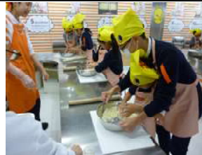
麺生地を作っている様子

チキンラーメン作りは、9時30分～11時00分の予定でスタートした。年少の子ども達は、お母さん・お父さんとペアになり、年長の子も達は友達同士でペアになって、体験テーブルに着いた。 用意されたチキンラーメンファクトリーのエプロンとヒヨコの三角巾を頭に着け準備完了。 スタッフの指示に従い麺作りが開始された。麺には、小麦粉に食塩・ビタミン・カルシウム・ごま油・チキンエキス・香辛料エキス・薄口しょうゆ・アミノ酸等を