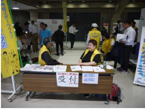
ミニ体力測定コーナーの風景

スタッフから、「全国平均より全然いいですよ。」と言われ、嬉しそうに微笑まれていた。