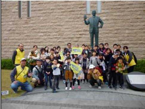
安藤百福像の前で記念写真

令和元年11月24日(日)大阪池田市の「カップヌードルミュージアム大阪池田」でワイスポ初体験となる「チキンラーメンファクトリー」での「チキンラーメン」作りを体験した。 また、チキンラーメン作りを体験した子ども達は、五月山公園に移動し昼食を摂った後、動物園の見学と、遊園地では滑り台などの遊具で元氣いっぱい楽しんだ。