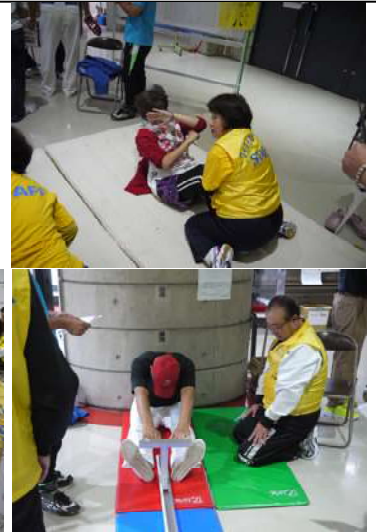
顔を隠しながら上体起こし 頑張るお母さん(右上)