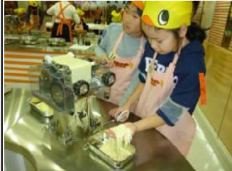
友達と協力して出てきた麺をハサミでカットしている様子(上) 出来上がった麺を入れる袋に絵を描く様子(右)

混ぜて麺生地づくりをスタート。 ペアで協力して練り上げた麺生地を麺棒で何回も折り曲げては伸ばす作業を繰り返した。麺生地を休ませる時間を利用してラーメンを入れる袋に自分だけのデザインをした。 平たく伸ばされた麺生地を麺作りの機械に通し麺が出てくると、長さ揃えてハサミでカット。 出来た麺をほぐし、容器に入れて油で揚げるまでの工程が終了。 油で揚げる工程は、危険なためスタッフが担当。子ども達は、ガラス越しに自分のラーメンの出来栄を心配そうに覗き込んでいた。 また、きれいに揚がってきたラーメンをスタッフがから見せられ嬉しそうに顔をしていた。 自分がデザインした袋に入れたもらい完成。