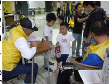
握力測定に挑戦している子ども達(左手にも力が) スタッフにも自然と力が...

ワイワイコーナーの「ミニ体力測定コーナー」で、全国年齢別・種目別平均に挑戦していた。 握力測定に挑戦した、幼稚園児の男の子、スタッフに説明されて必死で握るも3kg前後、真っ赤な顔をして頑張っていた。頑張っている子どもと一緒に頑張ってスタッフも力んでいた。 腹筋の筋力測定の上体起こしでは、70歳ぐらいの女性が、なんと50代の回数をクリアされ、スタッフを驚かせていた。 また、ちょっと太めの40代のお父さん、スタッフの必死の声掛け