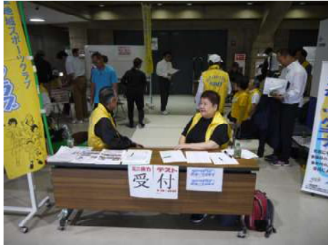
ワイワイコーナーの様子