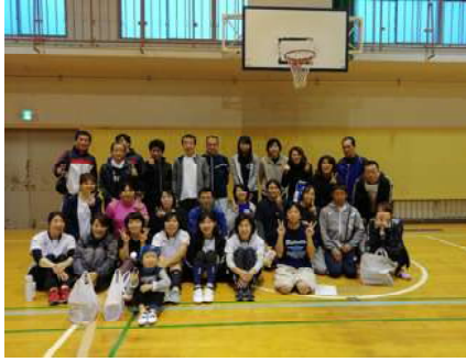
参加者が揃って記念写真