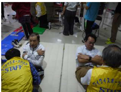
普段の運動不足を感じながら必死の形相で頑張る参加者