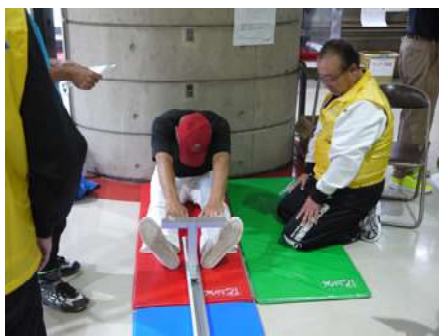
長座体前屈で1Cmでもと頑張る参加者

自分の記録を種目別平均と比較し、「よし!」と結果が良かった人。また、「残念!」と肩を落とす人もいた。