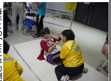
カメラを向けられ顔を隠しながら頑張るお母さん

毎年この「ミニ体力測定」に挑戦されている参加者は、去年と比較し自分の体力があまり落ちていないことを確認し、良かったとホットされていた。