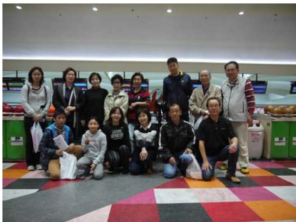
参加者全員の集合写真