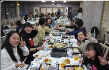
夕食の様子(上)と大人の方々とスタッフの意見交換会(右)の様子

フリーで参加されている大人の方々は、グループを作り思い思いにスキーを楽しんでいた。中には、久しぶりにスキーをし、「もつと滑れたはずなのに!」と体力の衰えに気づきシヨックを受けている参加者も。