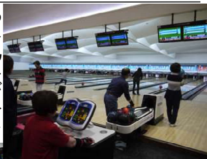
ボウリング大会の様子