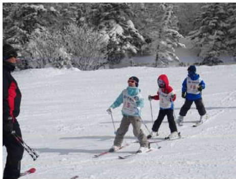
スキースクールで頑張る子ども達の様子