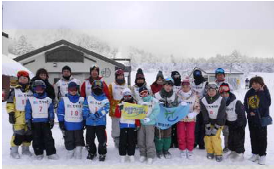
ホテル前での集合写真