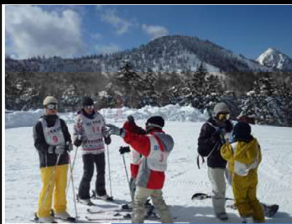
お母さんに 出会う