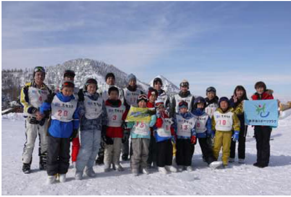
雪山をバックに記念写真の様子

向日市民体育館でスキーバスに乗り込み出発、途中JR宇治駅で東宇治スポーツクラブと合流し、横手山スキー場へと出発した。