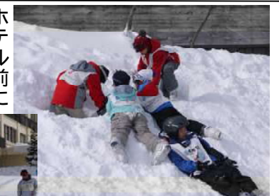
雪で遊ぶ子ども達

食事を終えた子ども達は、スキークウエアに着替え、スタッフの助けを受けながらスキー靴を履き終え、スキーとストックを持って、ホテル前に集合した。