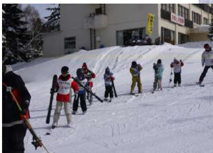
スキーを片方履き歩く練習をする様子