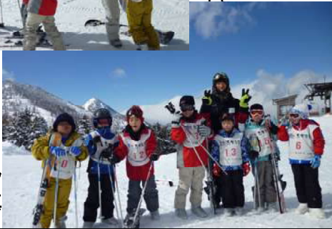
インストラク ターとの写真

初級グループの子ども達もボーゲンで インしながら滑れるまでに上達していた。 1日目を終えた参加者は、食べきれない ほどの夕食とバイキング料理をお腹いっぱい 食べていた。 2日目も晴天に恵まれ子ども達参加者 は、残された半日のスキーを楽しんだ。 帰りのバスでは、恒例となった「ビンゴ ゲーム」が開催され、用意された商品の争 奪戦が始まり、車中は大変な賑わいとなっ ていた。交通渋滞に巻き込まれることもな く、予定通りみんな元気で帰ってくるこ と ができた。 子ども達の感想は、「スクールに入り上手 くなった。楽しかった。また来たい。」 保護者の方々の感想は、「子ども達をスク ールで教えてもらい、安心して親同士でス キーを楽しむこ と ができた。来年も 参加したい。」な どの感想をいた