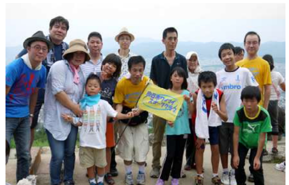
「火床にて記念撮影」