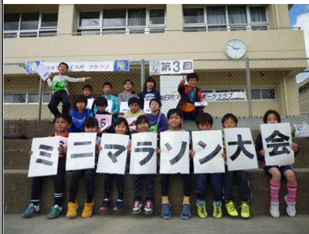
走り終わって記念写真に納まる参加者

各部に分かれ、参加した子ども達は、ピストルの合図とともに元気にスタート応援を受けながら懸命に走っていた。