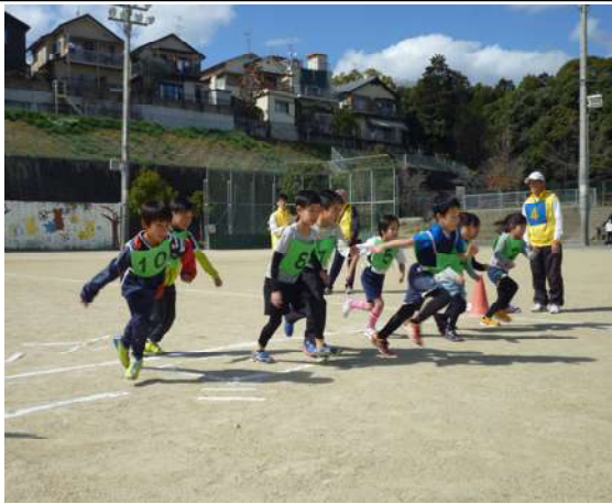
1・2年の部に参加した子ども達の元気にスタートの様子

構内の特設コースには、コーナートにスタッフ10名が立ち、子ども達の安全なマラソンを見守っていた。 ペース配分を間違えて途中でペースダウンをしてしまつ子ども、友達と競い合う子ども、いろんなレースが展開された。