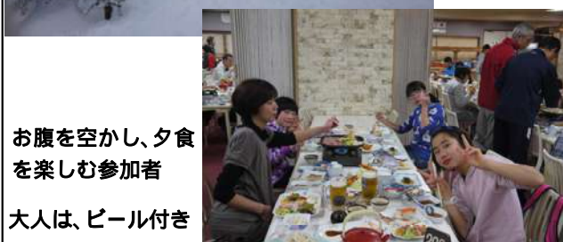
大人は、ビール付き