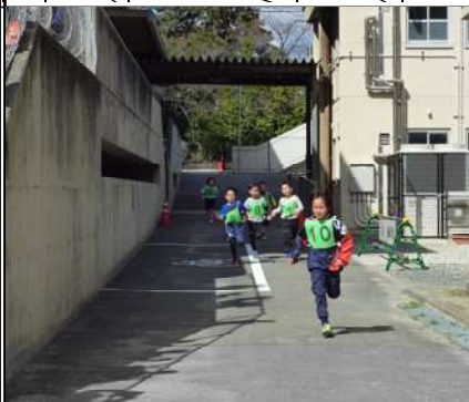
向陽小学校 特設コースの構内を懸命に走る子ども達