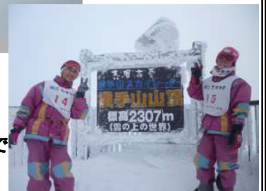
横手山山頂 2307mで記念撮影の初心者

勝手に滑っていくスキーに戸惑っていた子どもたちも徐々に慣れ、「こわい！」と言っていた子どもも、2日目には、スピードが出てもボーゲンで回転が出来るまでに上達していた。