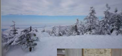
横手山山頂から見た素晴らしい雲海の様子

帰りのバスでは、恒例となった「ビンゴゲーム」でスキーの疲れを吹き飛ばすほど賑やかに盛り上がっていた。交通渋滞に遭うこともなく、予定より早く全員無事に帰宅することが出来た。 子ども達が書いてくれた感想文には、「教え方がわかりやすく、いろんな滑り方を教えてもらってよかったです。」「始めは怖かったけど滑ってみて楽しかった。」「先生が優しく嬉しかった。とても楽しかった。」「ご飯のときにもバイキングがあった。」「ご飯のときにも楽しかった。来年も来たい！」などの有り難い感想を寄せてくれていた。 来年は、参加者の倍増を期待して。