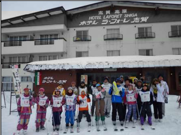
ホテル前グレンデに集合した参加者達