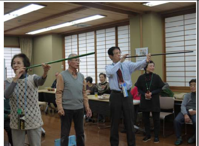
スポーツ吹矢を体験する参加者

実技指導では、2名ずつ指導者の丁寧な指導を受け、緊張しながら的に向かつて矢を放っていた。