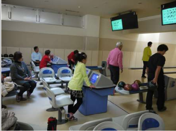
ボウリングを楽しむ参加者達

ハウスボールを探すときに、穴に指を入れ構えてフィット感を確かめる人、また、指にテーピングをしている人、ゲームが始まるまでの準備を思い思いに行っていた。