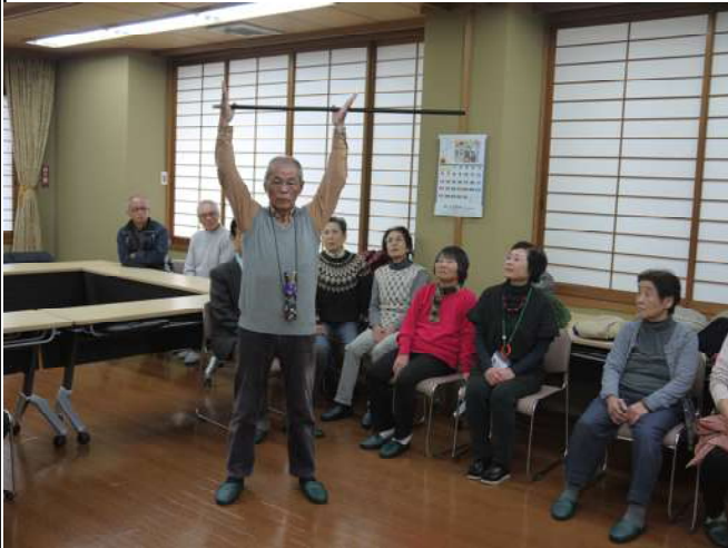
デモンストレーションを行う指導者に注目する参加者

的に向かつて「ブシュッ！」と吹かれたかと同時に勢いよく的に突き刺さる矢を見て参加者は「ウオー」と、何が起ったのかと一瞬静まり返った。