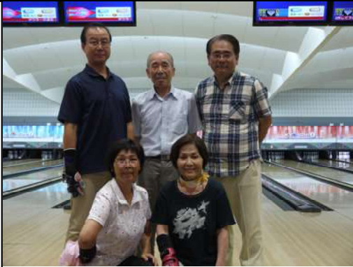
ワイwisポ ボウリング会員メンバー