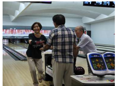
ストライクを取ってにこやかにハイタッチ！

普段の運動不足を感じられている方、続けられるスポーツを探されている方、一度体験されてはいかがでしょうか？