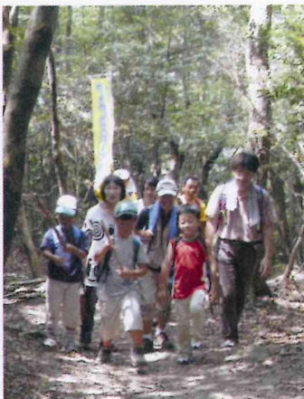
元気な足取りの参加者達

で南禅寺に向かって出発した。山越えの山道は、荒れ放題の所もあり、滑ったり、転びそうになって木に助けられたり、スリル満点。子ども達は普段体験できないことに、大喜び、ますます元気になっていった。軽装で参加された人は、「楽しいけど、今回はチョット甘く見ていた」と反省しきり。「来年は、装備を整え友達を誘って必ず参加するので続けてほしい」と、再挑戦を決議されていた。子ども達は、全て保護者同伴のため、南禅寺門前にて解散とした。