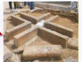
大の字の中央部の火床

銀閣寺前から出発した子ども達は、山道に入るにつれ言葉は少なくなっていくが、すでにお参りを終え降りて来られた人とすれ違う時には、元気よく「おはようございませう」と声をかけていた。山道に現れる昆虫に立ち止まったりしながら、クワガタ探しに懸命だった。 11時前に火床に到着した参加者達は、京都市内を山頂から見下ろしながら、景色を楽しんだ。又、大文字山から見える「妙法の文字」「鳥居型」「舟型」「左大文字の文字」を探した。