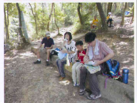
木陰に座って昼食タイム

で南禅寺に向かって出発した。山越えの山道は、荒れ放題の所もあり、滑ったり、転びそうになって木に助けられたり、スリル満点。子ども達は普段体験できないことに、大喜び、ますます元気になっていった。軽装で参加された人は、「楽しいけど、今回はチョット甘く見ていた」と反省しきり。「来年は、装備を整え友達を誘って必ず参加するので続けてほしい」と、再挑戦を決議されていた。子ども達は、全て保護者同伴のため、南禅寺門前にて解散とした。