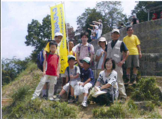
火床での集合写真

集合・出発は、少し遅れたが申込者は全員参加された。参加者は、会員大人2名、ビジター小学生3人、大人3人、スタッフ3人の合計11人で元気に出発した。