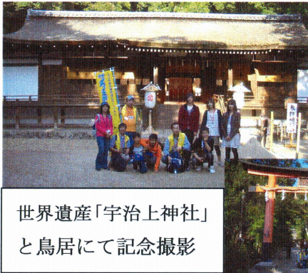
世界遺産「宇治上神社」と鳥居にて記念撮影

宇治川に架けられた「天ヶ瀬吊橋」を渡り「宇治十帖」・世界遺産の「宇治上神社」へ、ガイドはワイスポメンバーを中心に熱心にしていただいた。