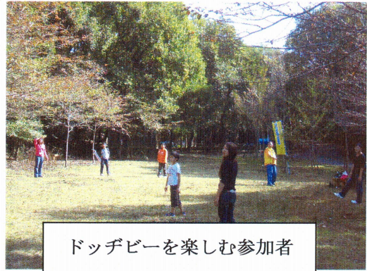
ドッジビーを楽しむ参加者