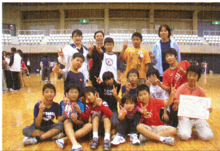
優勝のワイスポドッジビーチーム

表彰式では、前に立った二人はちよつと緊張気味であったが、表彰状を持つての記念撮影では、満面の笑みを見せていた。感想は、との問いかけに参加者は「楽しかった」と嬉しそうに、ニコニコ顔!