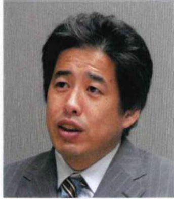
「二宮 清純 氏」

会場となった向日市民会館には、約350名が参加された。講師の「二宮清純氏」は、北京五輪の野球とソフトボールを例に挙げ、スポーツにおける準備の大切さ「準備は結果を裏切らない」と、普段の練習の大切さを説明された。 また、スポーツは楽しむものであり、地域の人々によって支えられ、発展させていくべきものであると話されていた。