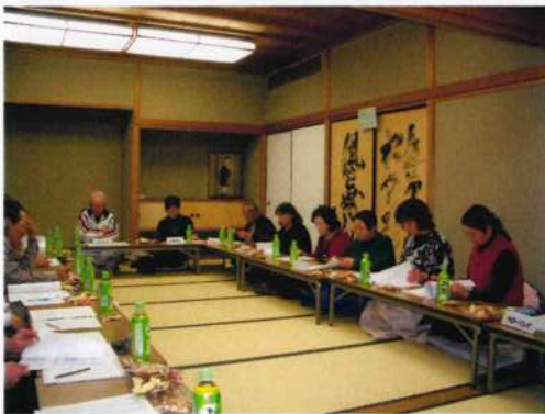
向日市民会館和室での指導者懇話会の様子

また、参加いただいた、指導者の方々には、「一人でも多くの人にスポーツの楽しさ・する喜びを知っていただきたい！」という思いが溢れていた。