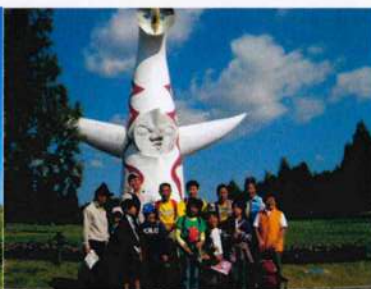
「太陽の塔」をバックに記念写真(上) ソラード(空中観察路)を歩く子ども達(左)

散策コースの自然文化園に作られた、ソラード(空中観察路)は、地上5mほどの高さに木で作られた道であり、都会の中でも色々な木をまじかに観察しながら自然を感じる事ができるところであった。