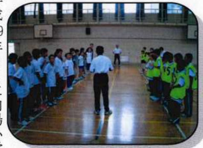
対戦に先立ち挨拶を行う子ども達の様子

平成19年8月に向陽小学校でスポーツ少年団の子ども達を招いて「ドッチビー交流会」が開催された。