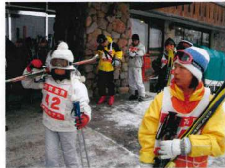
スキーを担いでホテルを出る参加者