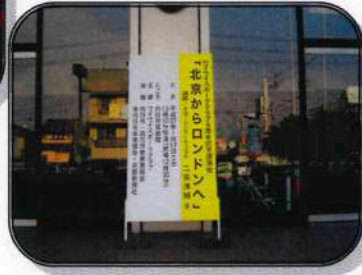
向日市民会館の玄関に置かれた後援会の立て看板(下)

スポーツジャーナリスト 二宮清純氏を迎えて！向日市民会館に於いて五周年記念講演会を開催 平成21年1月にワイワイスポーツクラブ創設5周年記念事業として向日市民会館に「スポーツジャーナリスト 二宮清純氏」を迎え、「北京からロンドンへ」と題して講演会を開催。