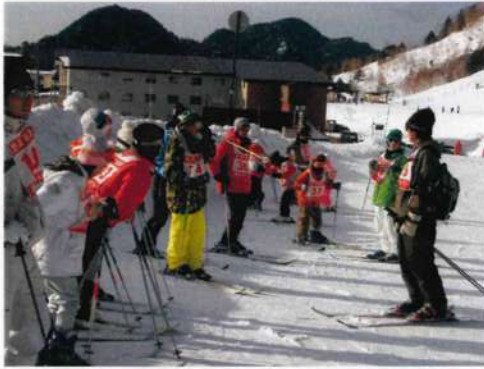
指導者の話を聞く子ども達の様子

スキースクールでは、初心者、初級者、中級者、中上級者とクラス分けをし、初心者には歩き方、起き方など基本を丁寧に、できるだけ根気強く指導されていた。参加者の中には、初級から中級