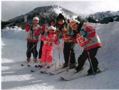
ゲレンデでポーズを決める子ども達

へ、中級から中上級へとどんどんステップアップしていく子どももいた。帰りのバスの中では、仲良かった子ども達は雪焼けした顔で、来年も必ず参加しようという再開を約束していた。