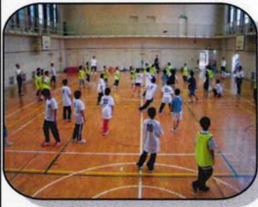
ドッチビー交流会を楽しむ子ども達の様子