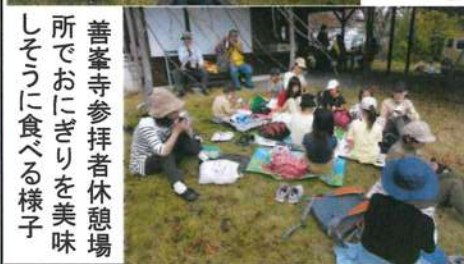
善峯寺参拝者休憩場 所おにぎりや美味 しそうに食べる様子

参加者の皆さんからいただいた感想を紹介します。「最初は山の中腹に見える善峯寺を遠くからみて、あそこまで行けるかなと思ったが、辛く思うことなく行くことができた。」「善峯寺では、一早い紅葉を見ることができ、心洗われた気分でした。」「日頃ゆっくりと歩く機会もなかったもので、いい気分転換にもなりました。」「子ども達も疲れたとは言っても、最後まで元気に歩き切ったのは驚きでした。」「なかなかあの距離を自分達だけで歩くのは難しいので、親子共々とても良い機会になりました。」「子ども達は、楽しかった。新しい友達と話ができてよかった。紅葉がきれいだった。また行きたい。」「また、来年の秋のイベントに参加したい。」「とのことでした。 コロナ対策にご協力いただきながらの参加、ありがとうございました。 来年も楽しい秋ハイキングを計画しますので楽しみにしてください。