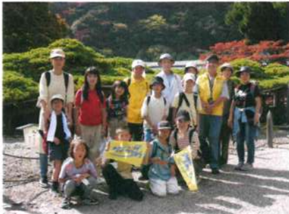
「遊龍の松」の前での記念写真

子ども達は、元氣よく向日神社を出発した。途中で、遠くに見える山の中腹の建物。スタッフが「これからあそこ迄歩くのやで！」と指を指すと「え！」と、子ども達は、チョット不安そう。「大丈夫！」と声をかけると子ども達は、氣を取り直しスタッフ