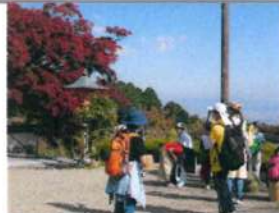
奥の院「薬師堂」にて