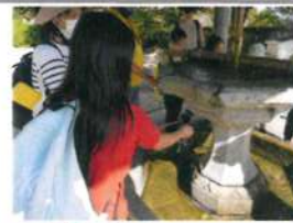
参拝の前に手を清める子ども達の様子