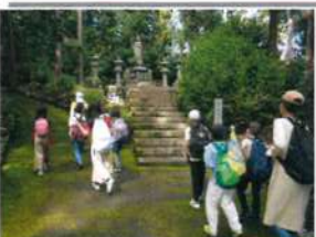
御陵を散策する参加者(上)と長い白壁の塀に沿って境内を散策する様子(右)

参加した、小学1年生から5年生までの子ども達は、みんな仲良く13kmを歩き切った。